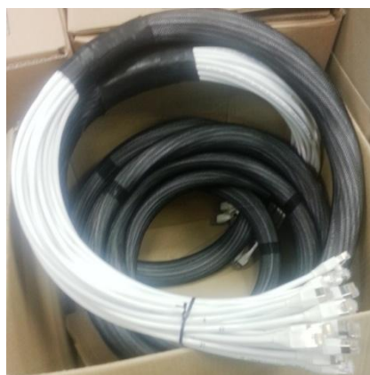
Cableado Cat7 preparado en fábrica Cubitel

Simplemente decida la categoría del cableado la longitud del cable, el número de cables, mazo/os y si desea identificación o etiquetado. Nosotros nos encargamos del resto.