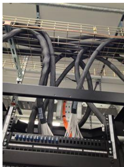
Material Cat7 instalado en cliente